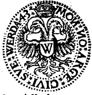
L'archevesque & Comte de Houft.